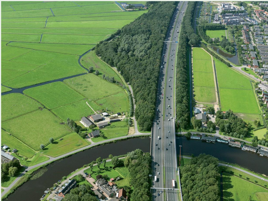
De locatie van de geplande verzorgingsplaats/tankstation.

Er zal een klankbordgroep in het leven worden geroepen die nauw betrokken wordt bij de aanwijzing van de noodzakelijk te kappen bomen. Met daarbij de verplichting voor Rijkswaterstaat en de door hen aangestelde aannemer om zoveel mogelijk bomen te sparen. SBA zal tezamen met de inwoners van Ouderkerk aan de Amstel ook hierin een actieve rol vervullen. Met betrekking tot het gebied ten zuiden van de Polderweg, grenzend aan de Bullewijk en in eigendom van RWS wenst SBA nauw betrokken te worden bij de herinrichting.